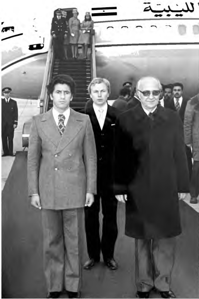
استقبال رئيس وزراء بولندا إدفارد راتشنسكي لعبد السلام جلود، بولندا.